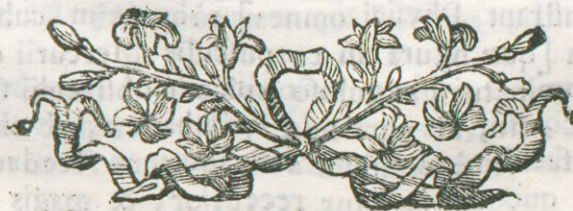
(a) Observations inquirens.